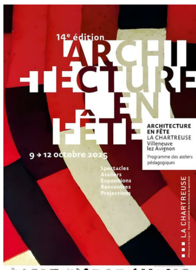
Table ronde | Architecture en fête

Dans le cadre du « Mois de l'Architecture Occitanie » nous avons organisé avec la Chartreuse de Villeneuve-lez-Avignon la table ronde : « Quelles limites à l'espace public ? ». Elle a réuni des intervenant·e·s (architectes, philosophe, urbaniste) pour débattre des tensions liées à l'espace public : frontière public/privé, normes d'exclusion, conflits d'usage, accessibilité.