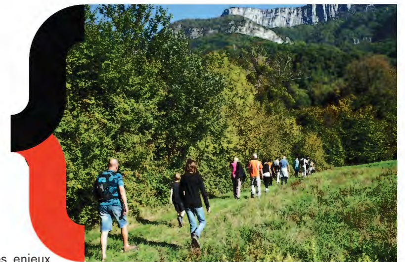
MA Isère - Ce qui nous lie - Saint-Gervais - 2025

L'équipe qui les entoure peut être à géométrie et professions variables, offrant ainsi des points de vue et des méthodes de travail variés et complémentaires .