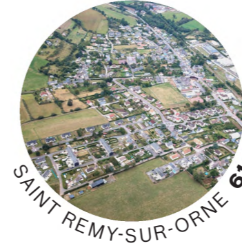
SAINT RÉMY-SUR-ORNE 61

MAISON DE L'ARCHITECTURE OCCITANIE MÉDITERRANÉE www.maom.fr contact@maom.fr 07 81 67 40 97