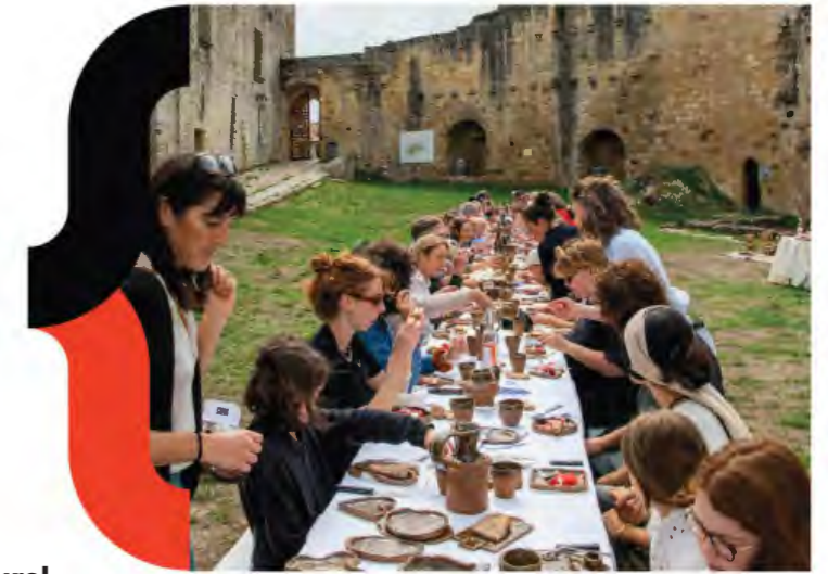
308 MA_Terre nourricière - Rauzan - 2025

Afin de permettre à tous de suivre le déroulement des résidences, chaque équipe créera et alimentera un site/blog dédié à la résidence et pourra produire un support de synthèse présentant leur démarche et leurs réalisations.