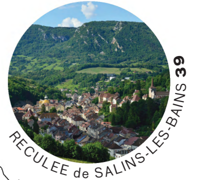
RECLÉE de SALINS-LÈS-BAINS 39