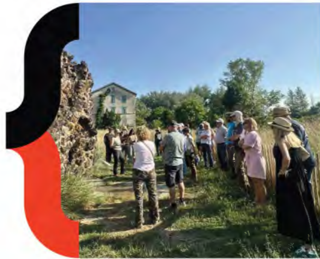
MA Auvergne - Réenchantons les thermes de Sainte Marguerite Saint Maurice - 2025

Ralentir. Faire une pause. Prendre du recul. C'est ce que nous nous étions promis il y a cinq ans.