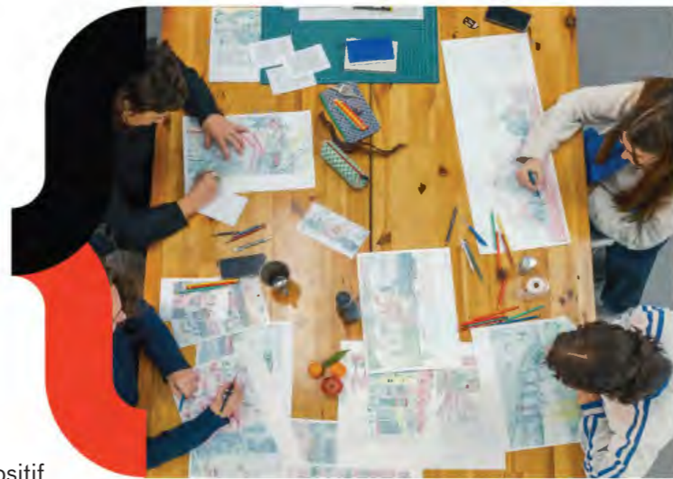
Territoires pionniers - Bassin de Caen, quels futurs - 2025

En 2026, le Réseau des maisons de l'architecture, grâce au mécénat de la Caisse des dépôts, a lancé un nouveau programme qui vise à travailler , par le prisme de l'architecture, du paysage et du cadre bâti, sur des thématiques engagées autour de questions environnementales et sociales , de résilience, de ménagement des territoires, de transition écologique, de mutations architecturales en impliquant toutes les actrices et tous les acteurs au contact de tous les publics.